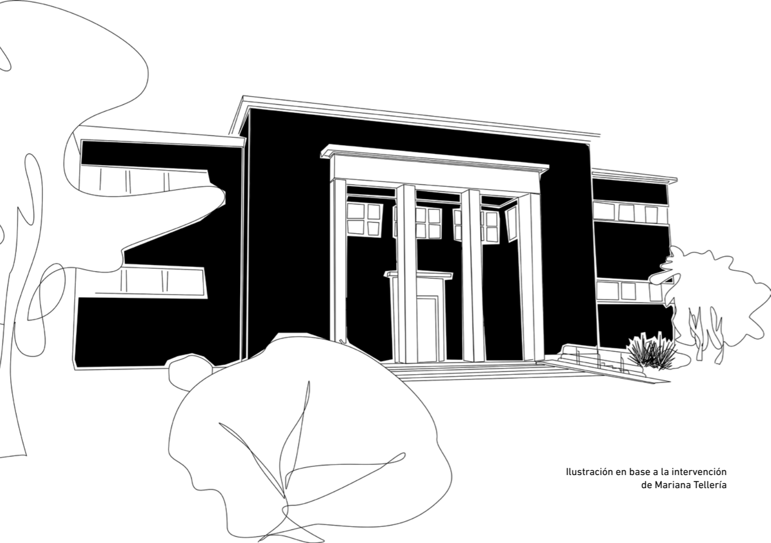
Ilustración en base a la intervención de Mariana Tellería