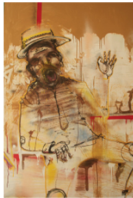
"El borracho" Roma Técnica mixta c/aerosol 150 x 210 cm. 2010.