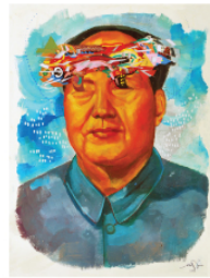
"Representación abstracta del pensamiento de mao sobre el comunismo aplicado en china" / Ever Aerosol sobre madera / 24 x 33 cm. / 2011