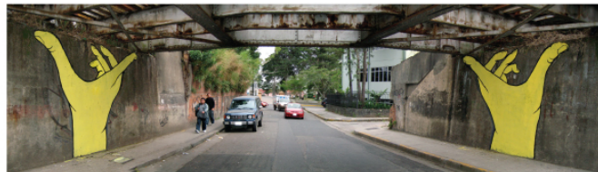
Gualicho / San José, Costa Rica / 2009 Fotografía digital.