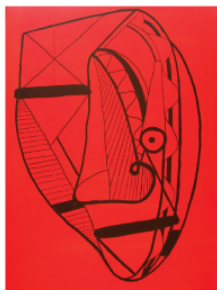
"Metamorfosis de una gota" Poeta Aerosol y tinta china. 2011