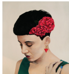
"Sister Rose" / Lucas Lasnier aka Parbo Serie "Girl's & Roses" / Acrílico / 90 x 100 cm / 2010.