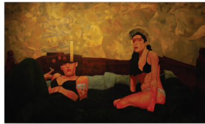
"Proceso de maduración de una mujer" / Ever Óleo y acrílico / 211 x 126 cm. / 2009